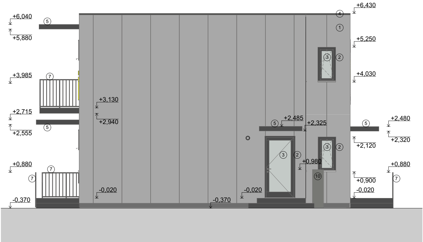
Pohled severní PIR panel 1:80